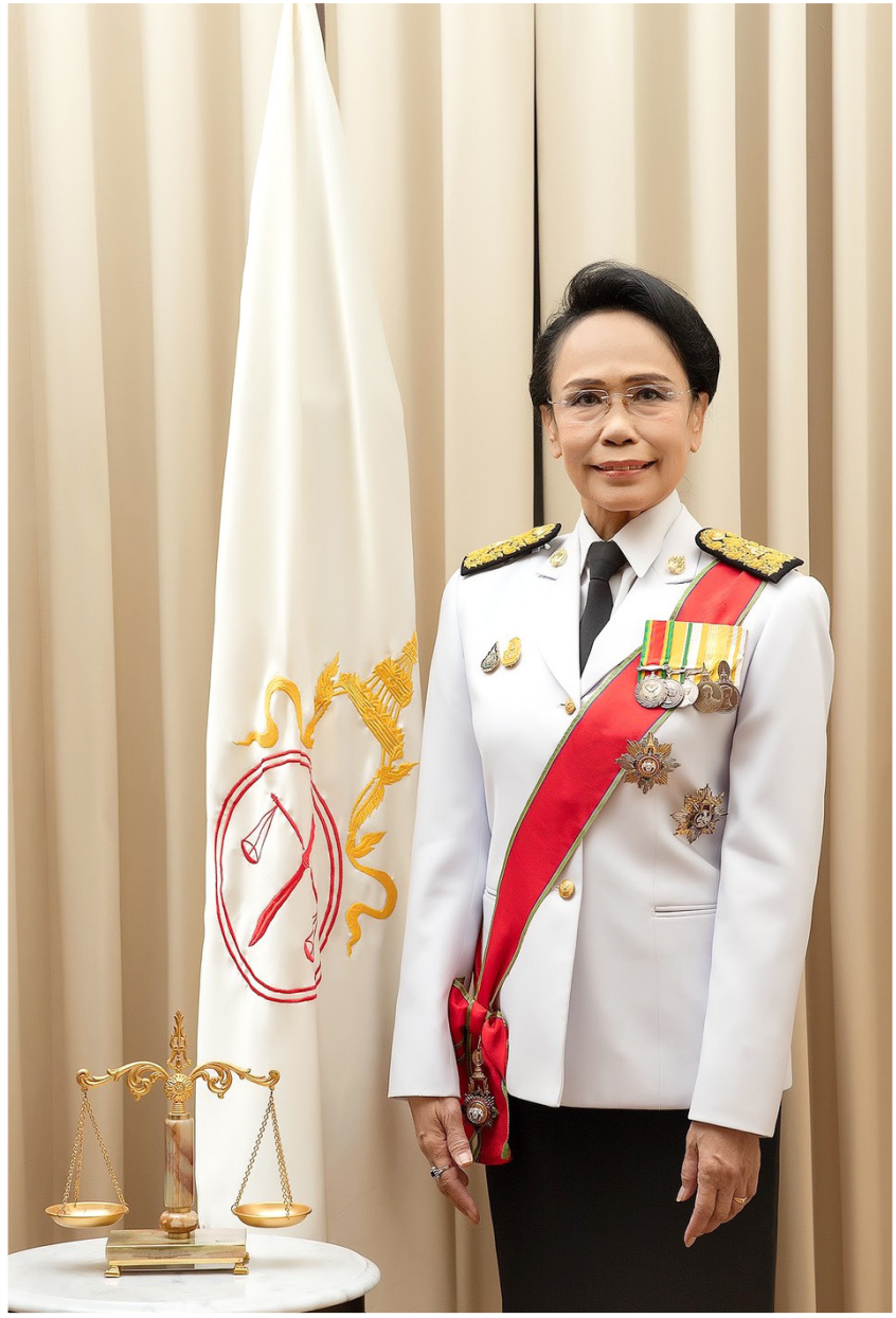
นโยบายประธานศาลฎีกา นางเมทินี ชโลธร ประธานศาลฎีกาคนที่ ๔๖